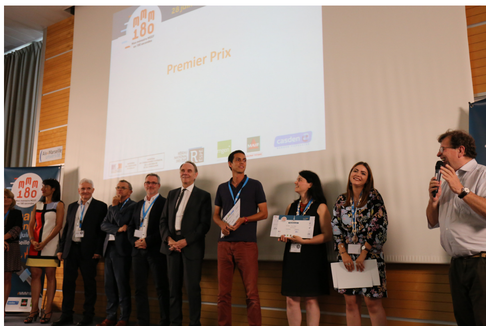
Remise des prix / Edition 2018