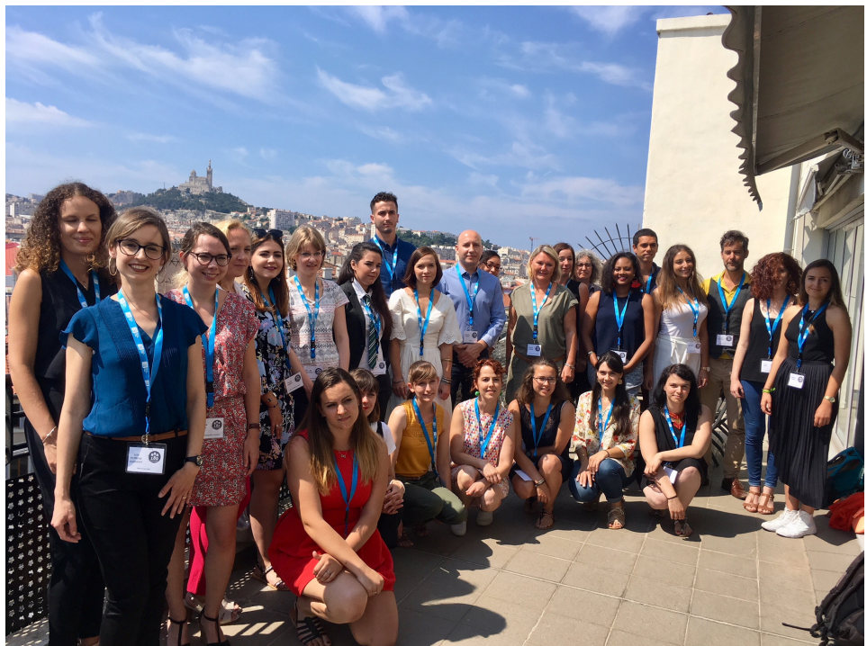
Candidats de l'édition 2018